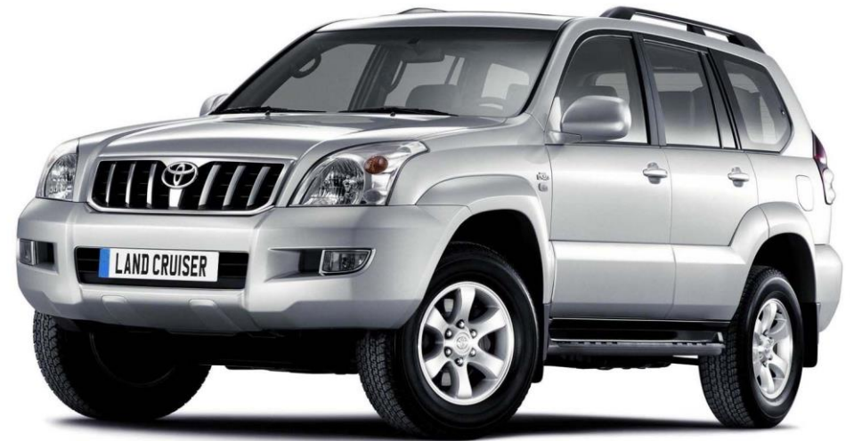
Kryt 1.0610.00 Toyota Landcruiser Prado 120